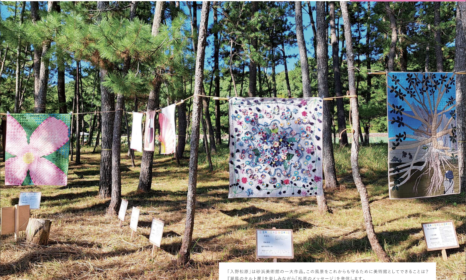
「入野松原」は砂浜美術館の一大作品。この風景をこれからも守るために美術館としてできることは？ 『潮風のキルト展』を楽しみながら「松原のメッセージ」を発信します。